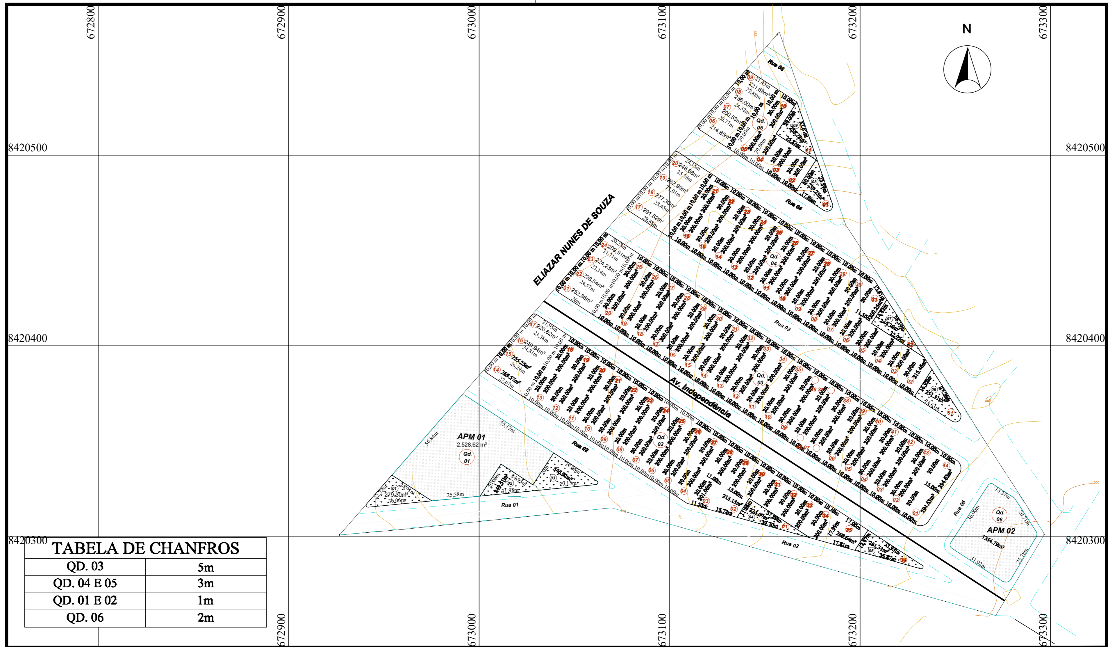
TABELA DE CHANFROS